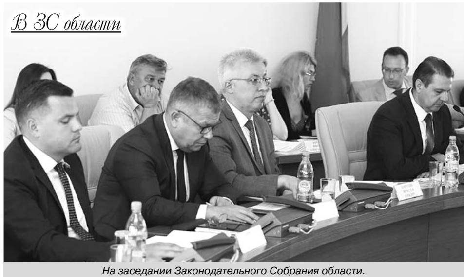
На заседании Законодательного Собрания области.

На июньском заседании Законодательного Собрания депутаты рассмотрели 12 областных законов и приняли ряд решений по просьбам избирателей.