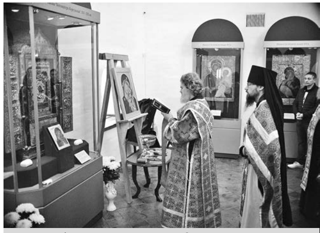
Молебен перед Корсунской (Суздальской) иконой Божией Матери.