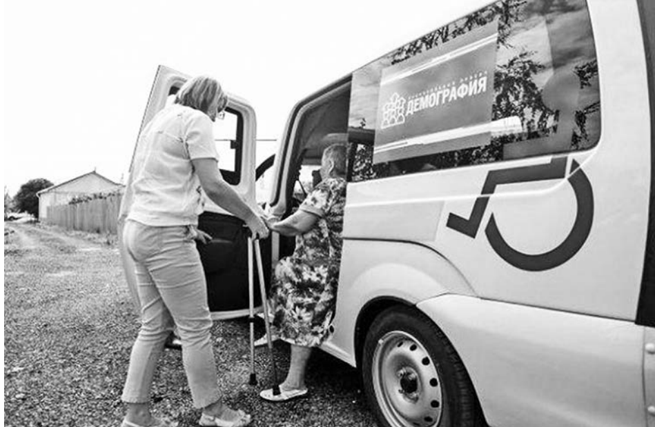
Доставка на диспансеризацию осуществляется на специальном автомобиле.

ДИСПАНСЕРИЗАЦИЯ И ДОСТАВКА ГРАЖДАН ОСУЩЕСТВЛЯЮТСЯ БЕСПЛАТНО