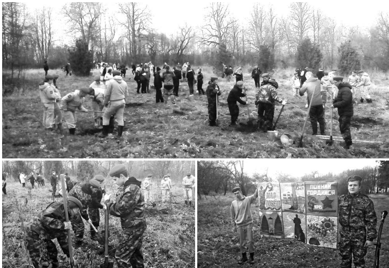
В селе Выпово высадили 100 саженцев сибирских кедров.

8 919 001-44-45 | Суздаль, Бульвар Всполье, д. 15-а