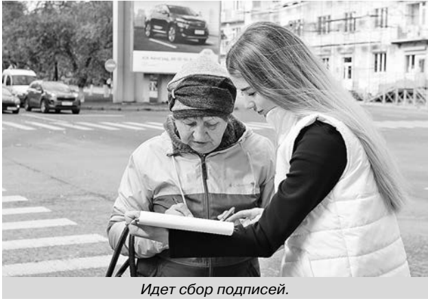
Идет сбор подписей.

«Я и мои коллеги-депутаты постоянно сталкиваются с обращениями граждан на эту тему. Жители домов, где располагаются «рюмочные», просто плачут - грязь, круглосуточно хульба, крики, ругань пьяной публики. Мы в регионе уже прорабатывали этот вопрос. И сейчас поддерживаем однозначное изменение, которые хотят внести депутаты в Федеральный закон «О государственном регулировании производства и оборота этилового спирта, алкогольной и спиртосодержащей продукции и об ограничении потребления (распития) алкогольной продукции». Если поправки будут приняты, это даст нам право, как субъекту, запретить розничную продажу