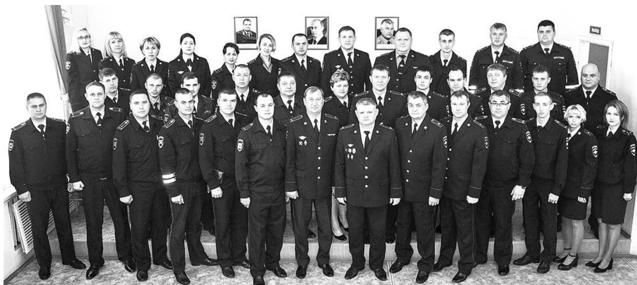
Аттестованные сотрудники ОМВД России по Суздальскому району.