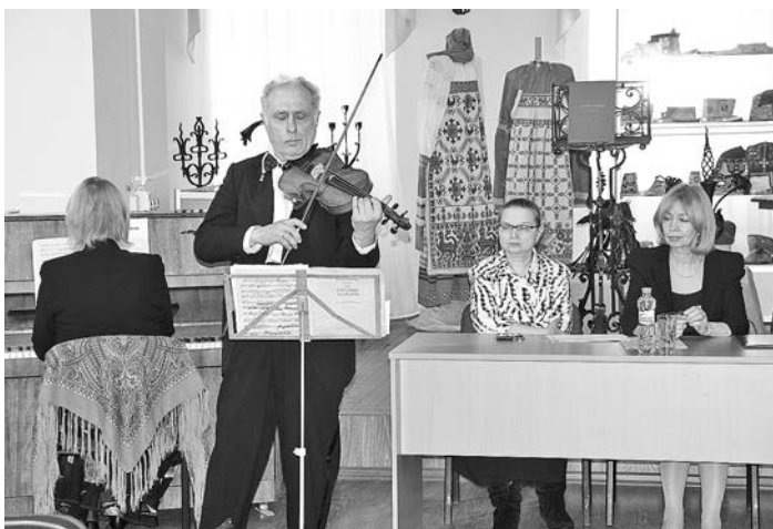
Выступление на втором межрегиональном фестивале «Секреты народных промыслов» в Суздальском филиале Санкт-Петербургского Государственного института культуры.