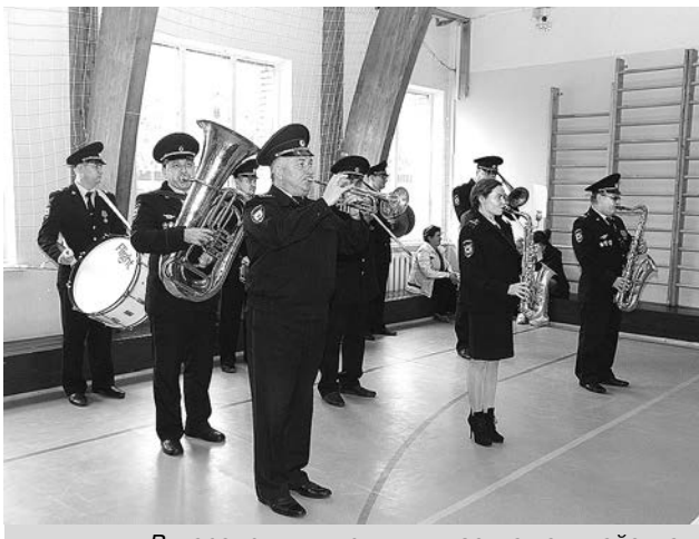
В мероприятии приняли участие полицейские и ребята из детских домов Владимирской области.