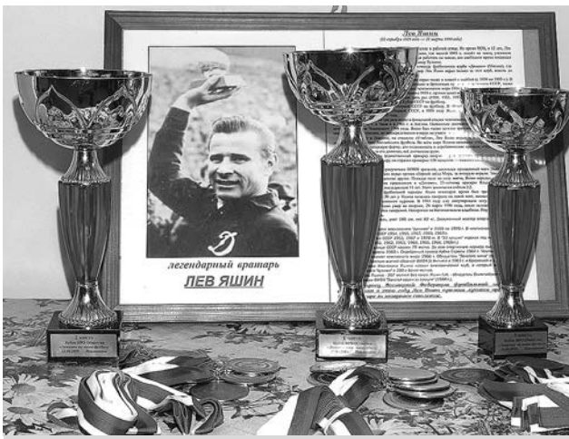
Льву Яшину исполнилось бы 90 лет.