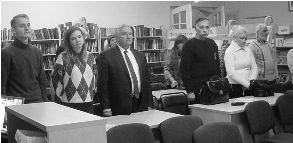
Участники конференции, посвященной великим русским полководцам Петру Багратиону и Александру Суворову.

На следующий день, 3-го ноября, после Божественной Литургии в Свято-Васильевском монастыре, участники встречи отправились из Суздаля в село Сима. Сюда