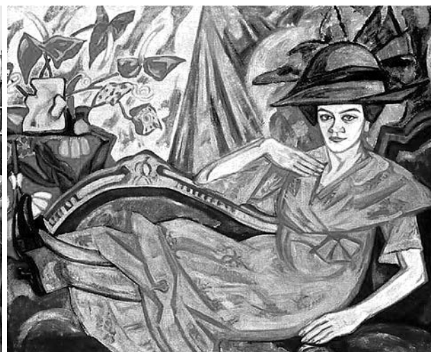
Ольга Розанова. Автопортрет.