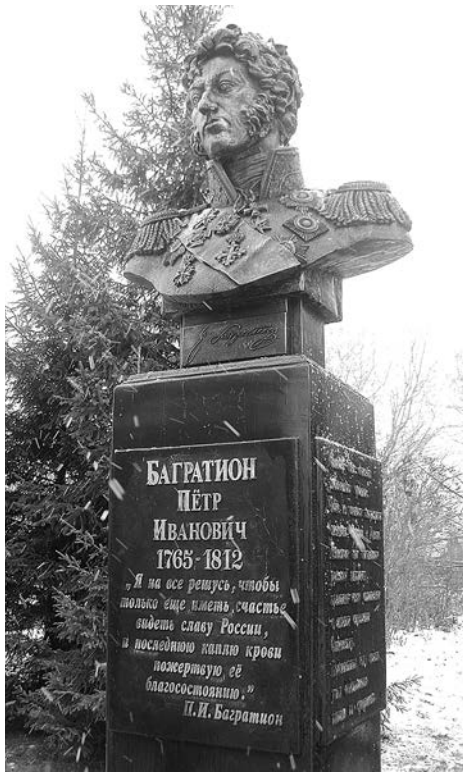
Памятник Багратиону в селе Сима.