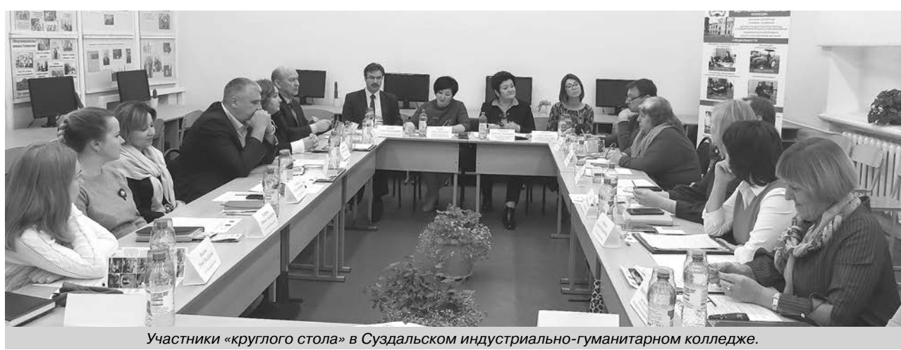
Участники «круглого стола» в Суздальском индустриально-гуманитарном колледже.