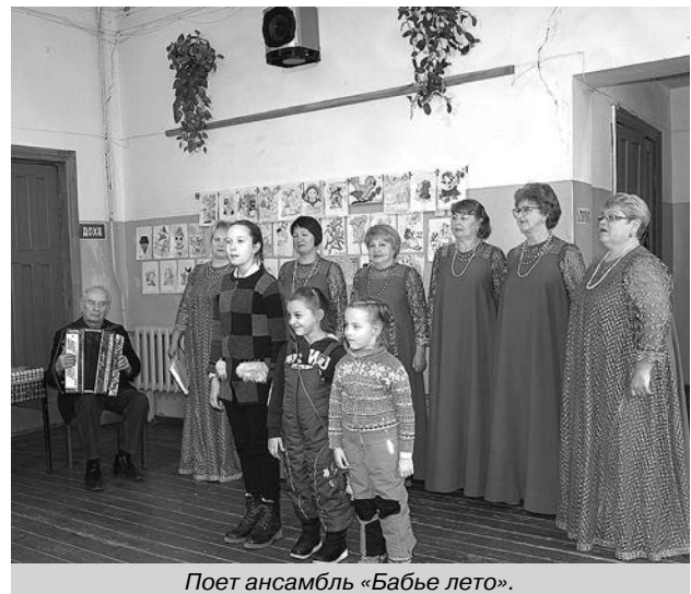
Поет ансамбль «Бабье лето».

бабушкам благополучия, здоровья, понимания и верности в семьях, ведь самое основное богатство - крепкая семья и радостные улыбки детей!