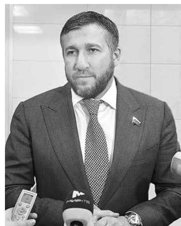
Депутат Госдумы РФ, председатель общественной организации «Милосердие и порядок» Григорий Викторович Аникеев:

Пресс-служба ВПОО «Милосердие и порядок».