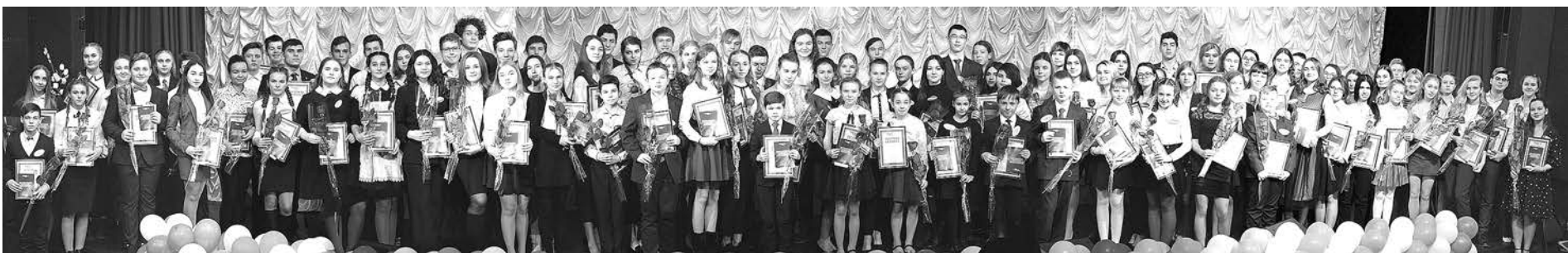
С 2001 года персональные стипендии получили несколько тысяч ребят.

«Важно заметить успехи ребенка и поддержать его во всех начинаниях: в творчестве, учебе, спорте, общественной жизни, исследовательской деятельности. Ведь дети — это будущее нашей страны».