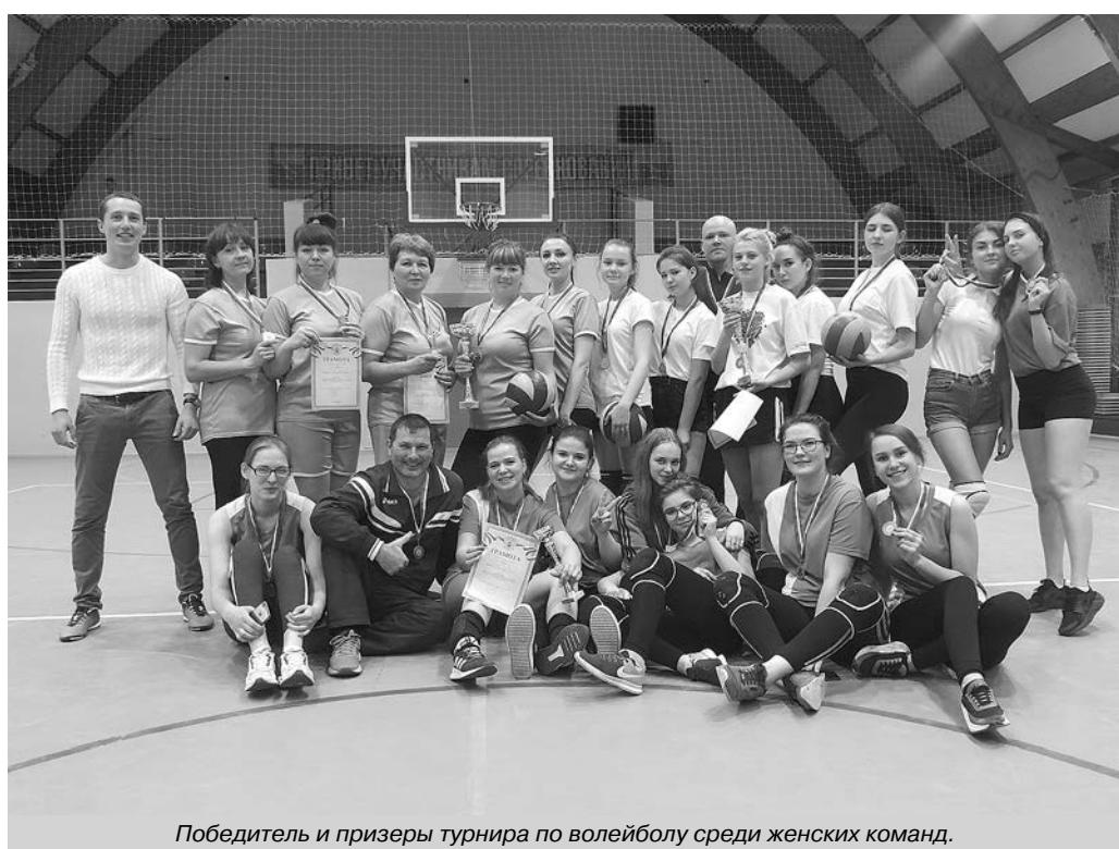
Победитель и призеры турнира по волейболу среди женских команд.

главный специалист отдела по культуре, спорту, семье и молодежной политике администрации Суздальского района.