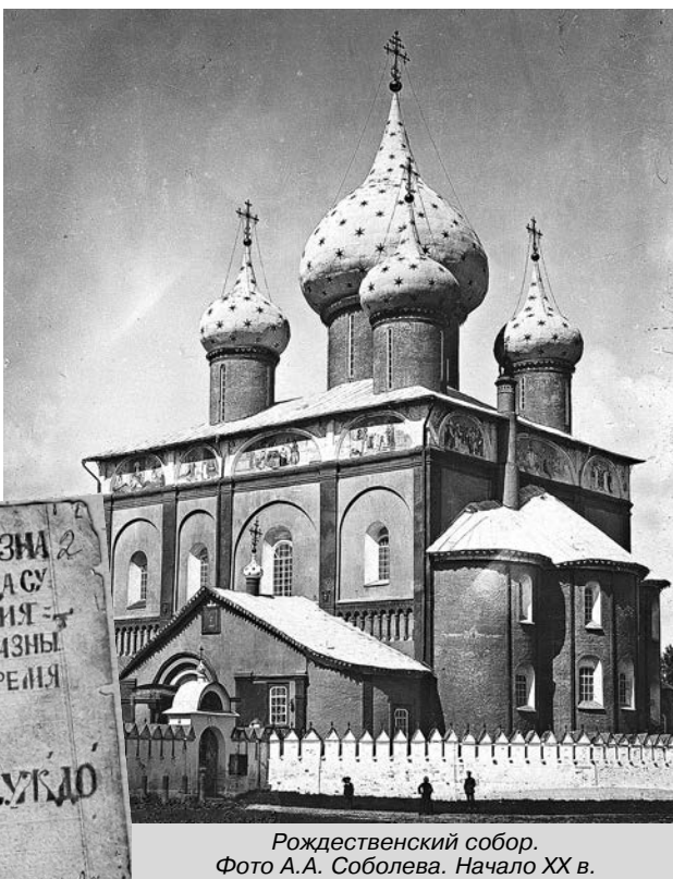
Рождественский собор. Начало XX в.

Изыскания о прошлом Суздала и его памятников архитектуры в XIX в. были продолжены. Интерес к прошлому не-