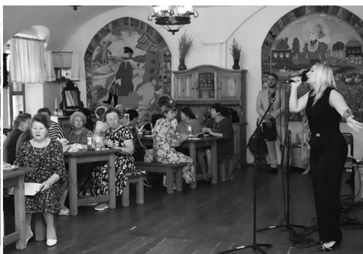
Поет Вера Фомина.