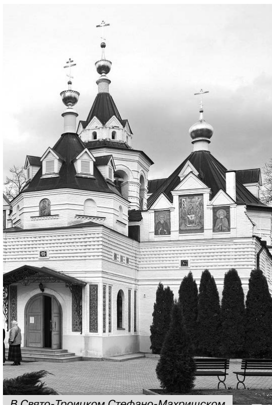
В Свято-Троицком Стефано-Махрищском ставропигиальном женском монастыре.