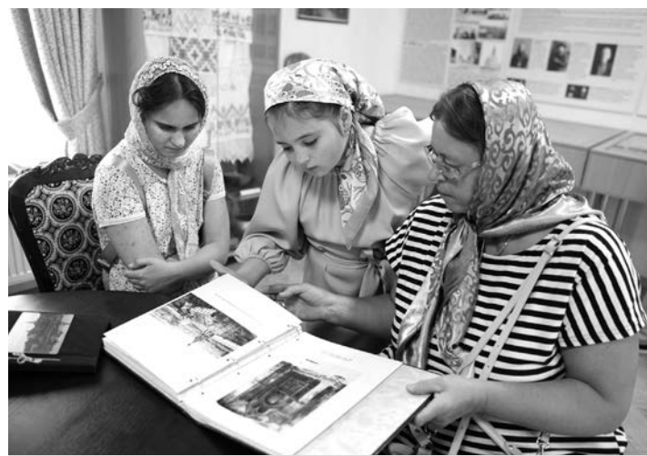
Паломникам было интересно все...

Иконы и церковная утварь увезены в музей и частично уничтожены. Вскоре в зданиях расположился дом инвалидов с помещениями для душевнобольных. С 1984 года территория обители была бесхозной, а в 1991 году передана по просьбе местных властей церкви, и монашеская жизнь в ней вновь возобновилась.