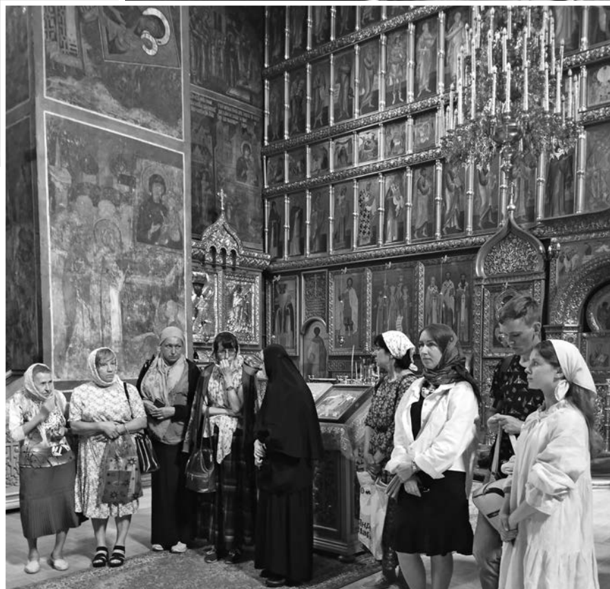
В Троицком соборе Успенского женского монастыря в городе Александрове.

В 1995 году насельники обратились за помощью к президенту концерну «Росэнергоатом». С тех пор руководители и сотрудники концерна не оставляют монастырь своим вниманием и заботой, оказывают большую помощь в восстановлении обители. Летом 1996 года начались работы по восстановлению главной святыни – храма над мощами преподобного Стефана. Храм рос буквально на глазах и 25 ноября 1997 года состоялось его освящение. Стефановский храм первоначально был освящен в 1558 году в присутствии царя Иоанна Грозного, а спустя 440 лет, престол во имя преподобного Стефана Махрицкого освятил Святейший Патриарх Московский и всея Руси Алексей II. 17 августа 2004 года по благословению Алексея II и решением Священного Синода монастырь обрел статус Ставропигиального. 30 июля 2005 года Святейший патриарх вновь посетил Махрицкую обитель.