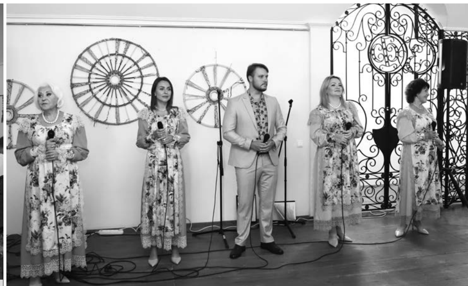
В концертной программе приняли участие артисты ДК с. Новое - ансамбль «Вишень».