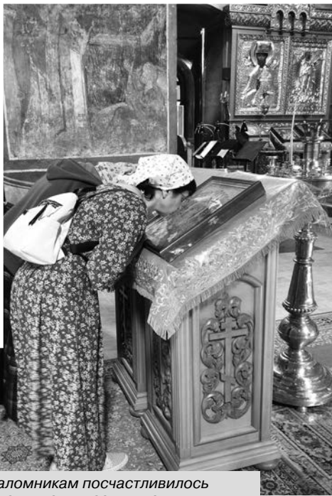
Паломникам посчастливилось приложиться к местным святыням.