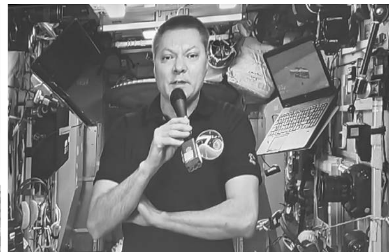
Поздравление из космоса от командира отряда космонавтов Роскосмоса Олега Кононенко.