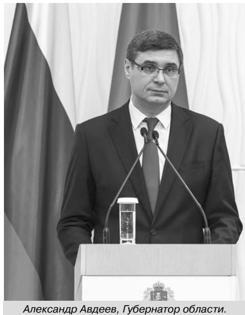
Александр Авдеев, Губернатор области.

Владимирский областной парламент празднует 30-летний юбилей и принимает поздравления. Первый созыв Законодательного Собрания Владимирской области был сформирован в 1994 году.