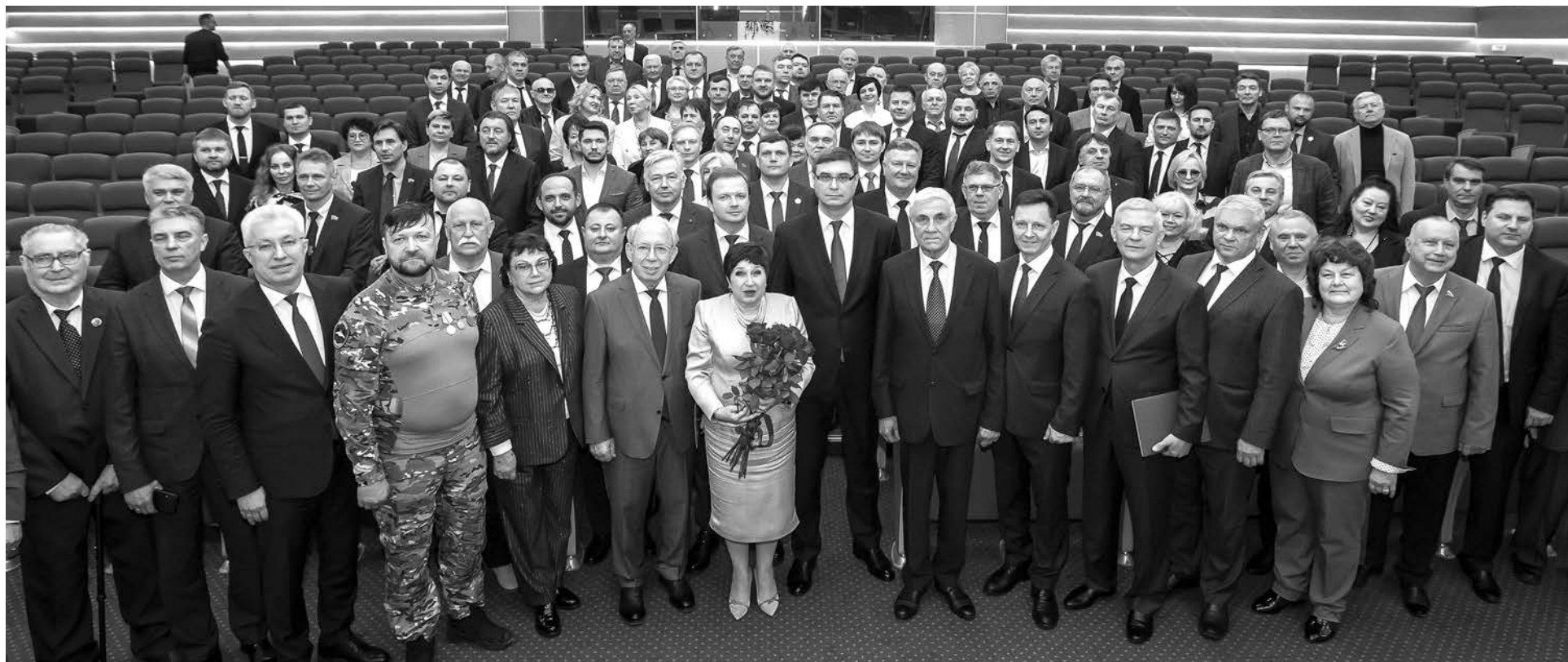
Участники торжественного собрания, посвященного 30-летию Законодательного Собрания Владимирской области.