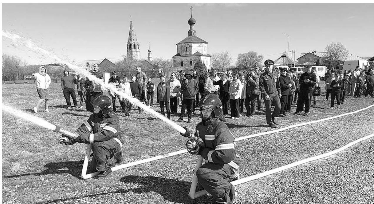
На занятиях с учащимися общеобразовательных учреждений Суздальского района.

А.П. САРАЕВ, Глава администрации Суздальского района. В.В. КИРИЛЛОВ, Глава Суздальского района.