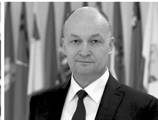
Владимир Киселев, председатель ЗС 5, 6 и 7 созывов.