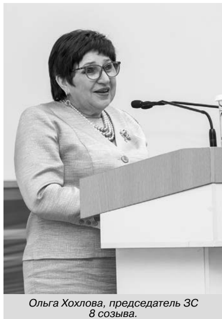
Ольга Хохлова, председатель ЗС 8 созыва.